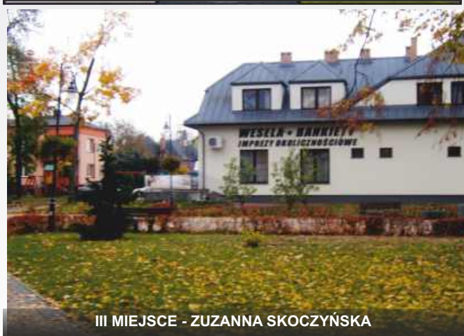
III MIEJSCE - ZUZANNA SKOCZYŃSKA