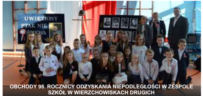
OBCHODY 98. ROCZNICY ODZYSKANIA NIEPODLEGŁOŚCI W ZESPOLE SZKÓL W WIERZCHOWISKACH DRUGICH