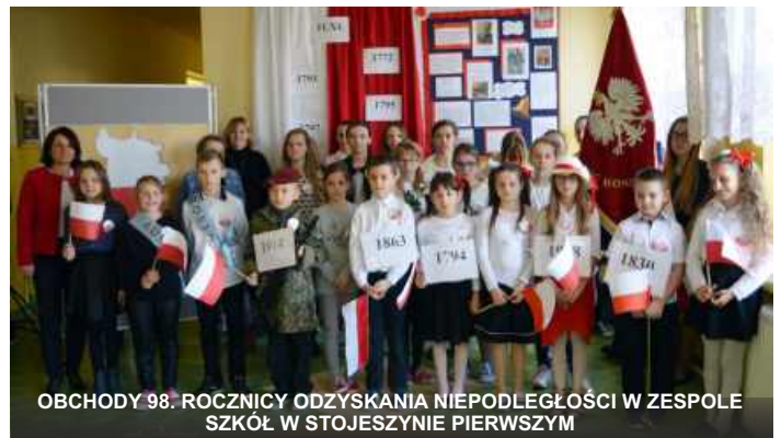
OBCHODY 98. ROCZNICY ODZYSKANIA NIEPODLEGŁOŚCI W ZESPOLE SZKÓL W STOJESZYNIE PIERWSZYM

Rada Miejska w Modliborzycach oraz Burmistrz Miasta Modliborzycze