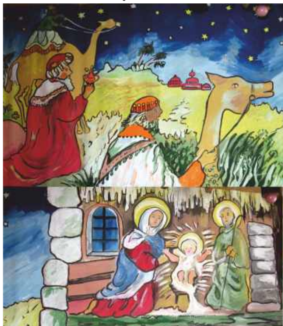
SCENKA RODZAJOWA „BOŻE NARODZENIE” - TECHNIKA GWASZ IRENA ROWICKA

Dane, dotyczące statystyki urodzeń i zgonów, podawane są na podstawie dokumentów otrzymywanych z innych Urzędów Stanu Cywilnego.