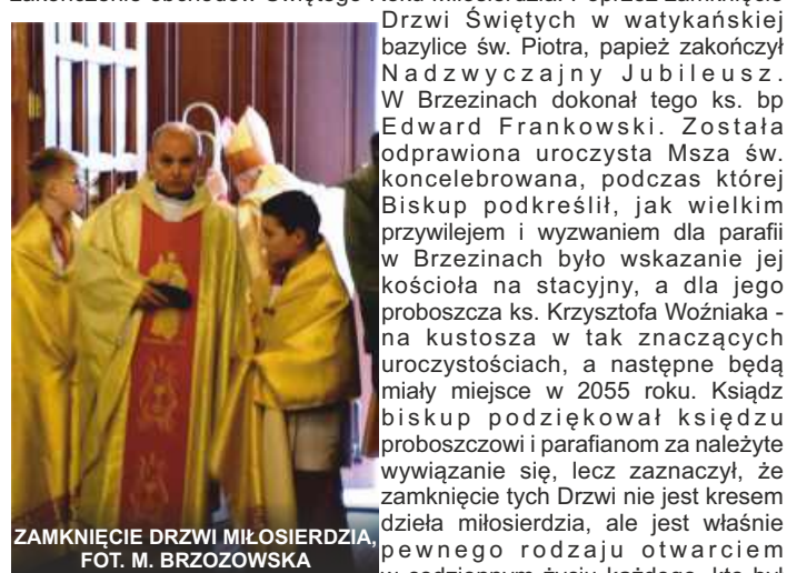
ZAMKNIĘCIE DRZWI MIŁOSIERDZIA

20 listopada 2016r., w święto Chrystusa Króla Wszechświata, zamykające rok liturgiczny w kościele katolickim, nastąpiło uroczyste zakończenie obchodów Świętego Roku Miłosierdzia. Poprzez zamknięcie