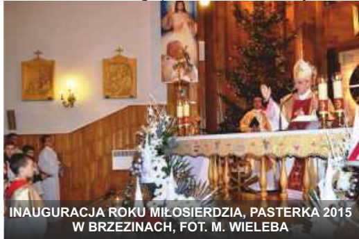
INAUGURACJA ROKU MIŁOSIERDZIA, PASTERKA 2015 W BRZEZINACH

Parafia w Brzezinach Stojeszyńskich ma dość nieodległą historię. W 1984 roku została erygowana z parafii Potok Wielki. Nowy kościół został dedykowany Miłosierdziu Bożemu, o którego orędziu i nowych formach kultu w świecie wówczas niewiele słyszano. Parafię stworzono z 12 miejscowości, należących jednocześnie do trzech gmin (Modliborzyce, Potok Wielki i Zaklików), dwóch powiatów (janowskiego i stalowowolskiego) oraz dwóch województw (lubelskiego i podkarpackiego).