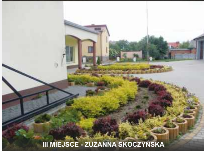
III MIEJSCE - ZUZANNA SKOCZYŃSKA