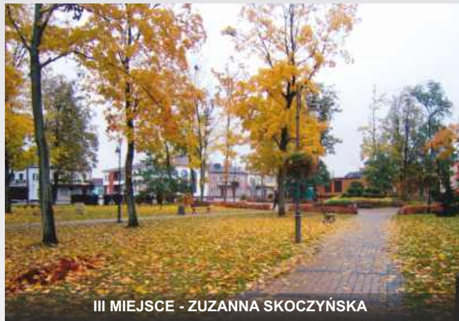
III MIEJSCE - ZUZANNA SKOCZYŃSKA