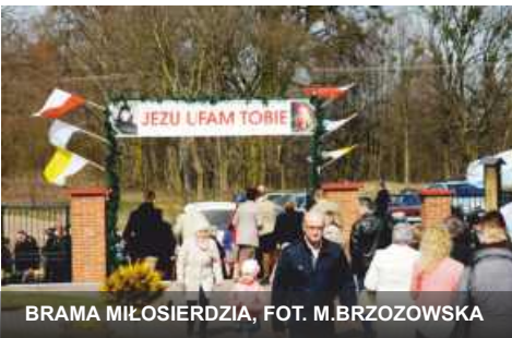
BRAMA MIŁOSIERDZIA, FOT. M. BRZOZOWSKA

stolicy Kościoła katolickiego. Również w kościele stacyjnym w Brzezinach została przygotowana taka specjalna brama. Dla wiernych wprowadzono wiele modlitewnych inicjatyw. W każdą niedzielę roku były odprawiane nabożeństwa Godziny Miłosierdzia. Codziennie miała