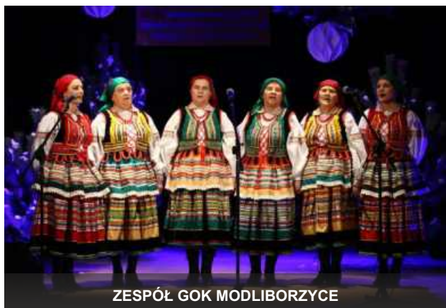
ZESPÓŁ GOK MODLIBORZYCE

9 stycznia 2016 r. na VI Ogólnopolskim Przeglądzie Zespołów i Grup Kolędniczych w Lublinie Zespół Śpiewaczy z GOK zajął III miejsce (wśród 35 zespołów występujących).