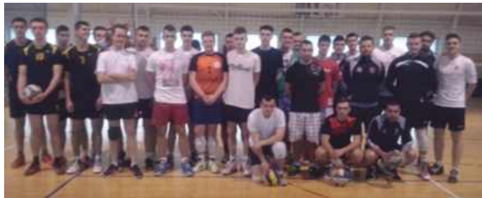
Skład GUKS Modliborzycy:

W sobotę 13 lutego 2016 r. drużyna GUKS Modliborzycy rozpoczęła rozgrywki Ligowe Powiatu Kraśnickiego w Piłce Siatkowej. Do ligi zgłosiły się 4 drużyny: Annapol, Książomierz, Modliborzycy i Trzydnik Duży. System rozgrywek to trzy turnieje systemem „każdy z każdym” do 2 wygranych setów. Drugi turniej rozegrany zostanie w dniu 6 marca 2016 r., natomiast turniej finałowy zaplanowany jest na 20 marca 2016 r. Wszystkie turnieje rozgrywane są w Hali Publicznego Gimnazjum w Trzydniku Dużym.