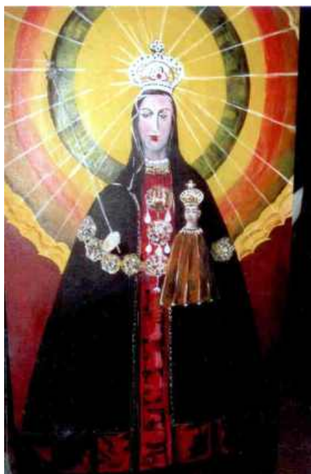
„MATKA BOSKA KODEŃSKA”