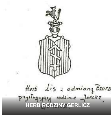
Herb Lis z odmianą Bzura przynależący rodzinie GERLICZ, HERB RODZINY GERLICZ