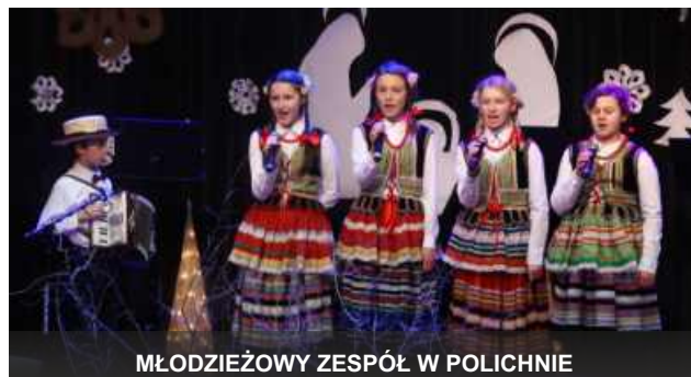
MŁODZIEŻOWY ZESPÓŁ W POLICHNIE

W dniach 18 – 22 stycznia w Puławskim Ośrodku Kultury odbywał się XXI Ogólnopolski Festiwal Kolęd, na którym wystąpiło ogółem ponad 1500 wykonawców (340 prezentacji).